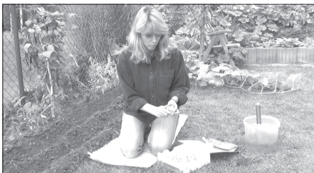
С надеждой на будущий урожай.

Для того, чтобы озимый чеснок не вымерз и дал хороший урожай, нужно соблюдать несколько важных правил.