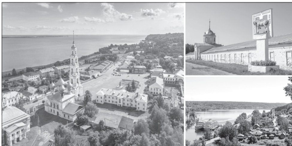
Будем благоустраивать наши малые города и тем самым возвращать в них жизнь.

Избранный губернатор Ивановской области Станислав Воскресенский по-