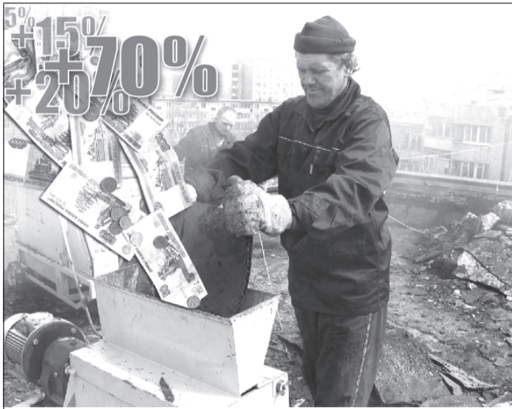
Доживём до капремонта.

Федеральным законом от 29.07.2018 № 226-ФЗ внесены изменения в статью 169 Жилищного кодекса РФ. С 1 января 2019 года субъекты Российской Федерации получат право распространять компенсацию расходов по уплате взноса на капремонт на новые категории граждан.