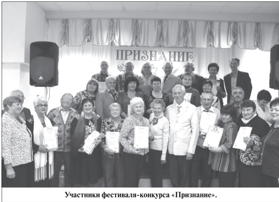
Участники фестиваля-конкурса «Признание».