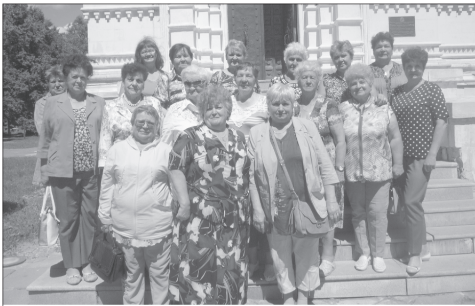
Активисты-ветераны в Гусь-Хрустальном.