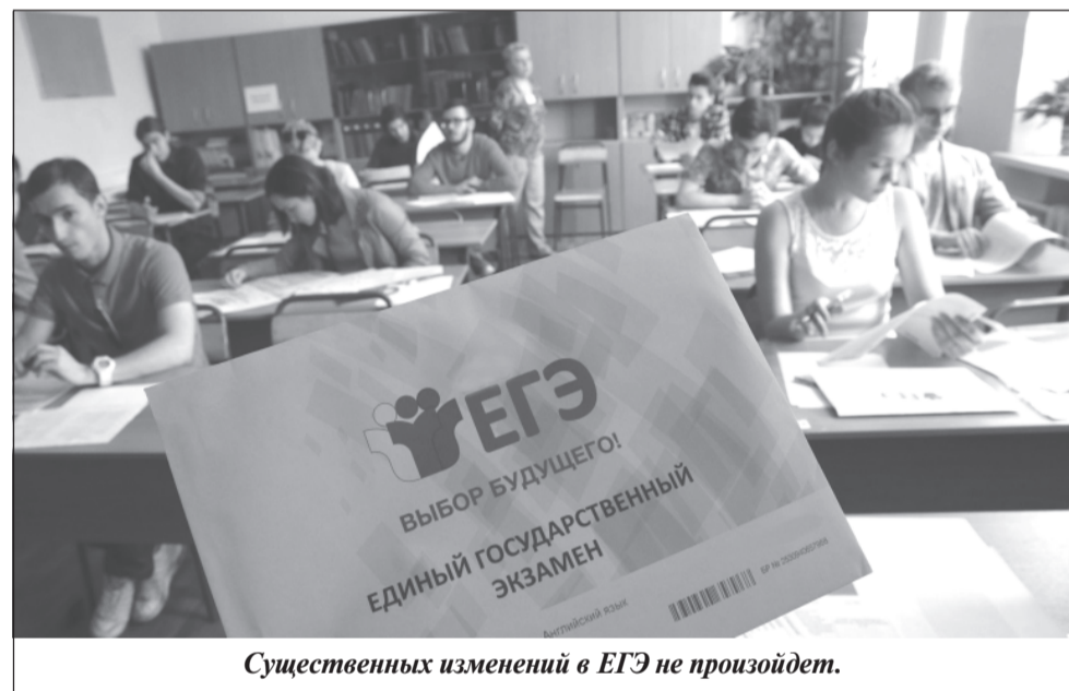
Существенных изменений в ЕГЭ не произойдет.

для выпускников, сдающих ЕГЭ: добавятся ли к ним история, география, физика и другие предметы. Сергей Кравцов напомнил, что с 2022 года в число обязательных предметов ЕГЭ будет включен иностранный язык. Будет ли при этом экзамен разделен на базовый и профильный уровни, подобно ЕГЭ по математике, пока обсуждается. Что касается других предметов, то по ним таких решений