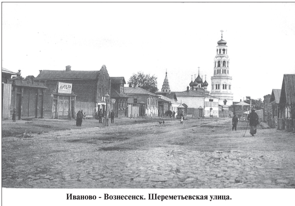
Иваново - Вознесенск. Шереметьевская улица.

20 июня 1918 года постановлением коллегии при Народном комиссаре по внутренним делам была утверждена Иваново-Вознесенская губерния с центром в г. Иваново-Вознесенске в составе территорий, определенных III Съездом Советов Иваново-Кинешемского района.