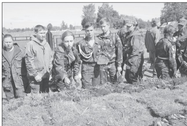
Сохраним память о погибших в годы войны.